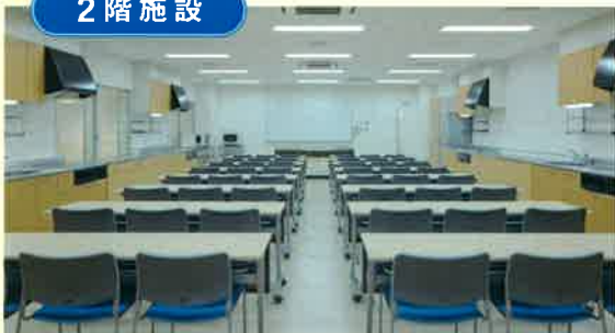
▲会議・調理実習室