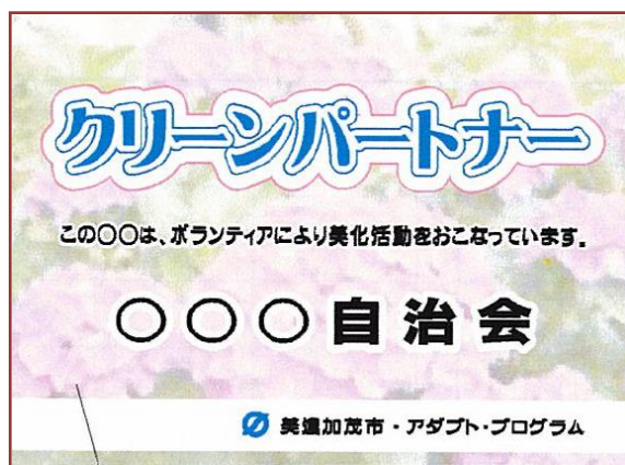
サインボードのイメージ

ピカまある隊に参加し、サインボードの設置を希望する活動団体については、活動団体名を記載したサインボードを美濃加茂市が設置します。設置個所・設置基数については、一定の基準をもとに、団体と協議の上、決定します。なお、サインボードの発注と関係機関への占用申請等の関係で、設置までに1～4ヶ月程度かかる場合もありますので、ご了承ください。