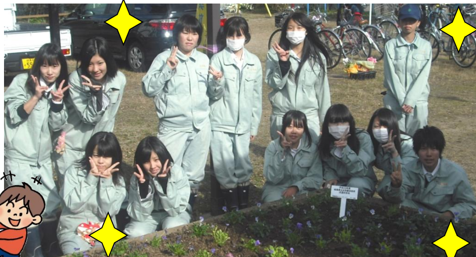
↑全員で記念写真。作業を終え、みんなの笑顔がとても素敵でした！