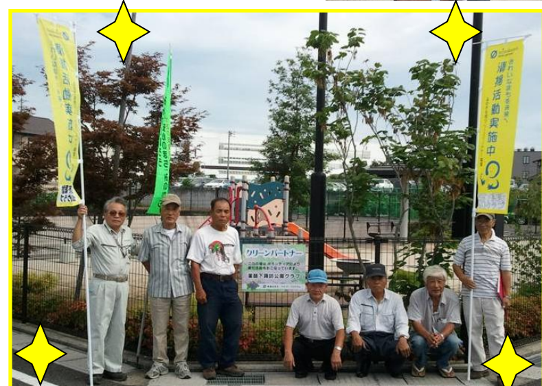
↑全員で記念写真。これからもご活躍を期待しています！