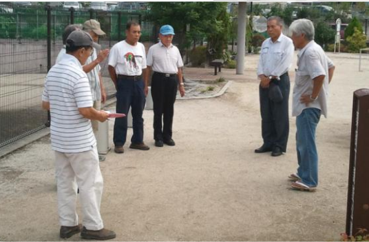
↑今後の活動について、話し合いをされました。