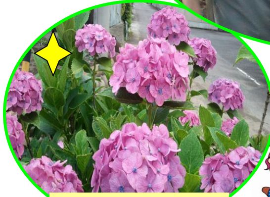
美濃加茂市の花 あじさい