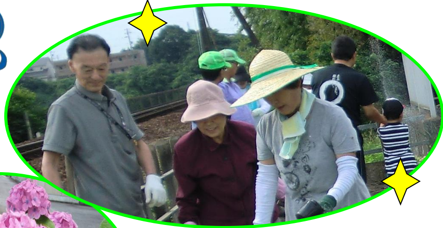
←今渡ダムも見える 景観スポット