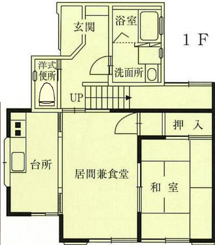
〈 平面図 〉