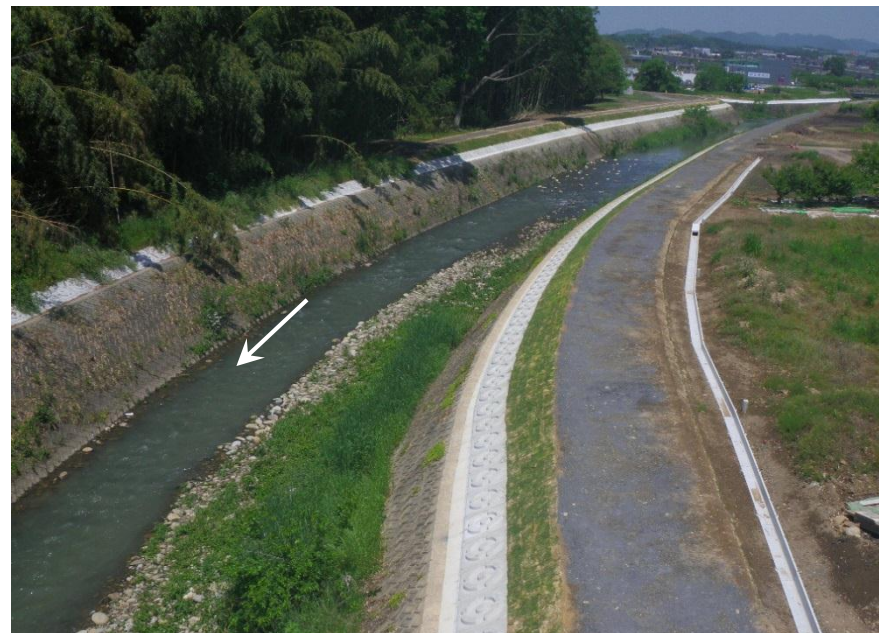
寿後川合流点下流付近 改修工事完成後

平成25年度 用地測量、 下流より河道掘削、護岸嵩上げ工事に着手 平成26年度 用地買収 河道掘削、護岸嵩上げ工事の実施 平成27年度 寿後川合流点までの改修工事が、5月に完成 平成28年度以降 寿後川合流点より上流の改修工事を順次実施中