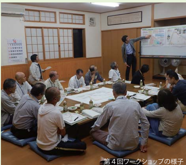
第4回ワークショップの様子