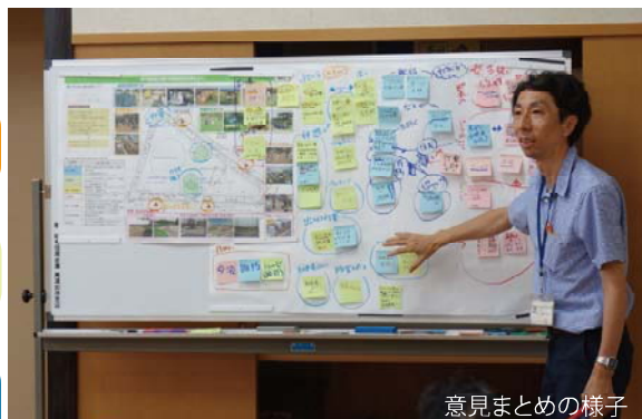
意見まとめの様子