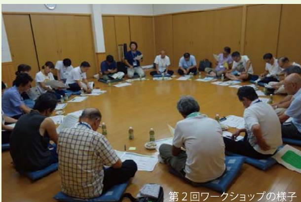
第2回ワークショップの様子