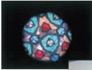
① 廃びんで作る 万華鏡