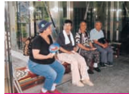
正面入り口 午前8時20分

福祉会館には、自由に利用できるお風呂やマッサージ機などいろんな設備が整っています。福祉会館での楽しみ方は人それぞれ。そこで、多くの人にぎわう福祉会館の1日を追いながら館内をご案内します。