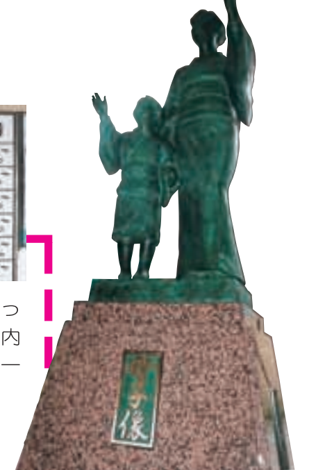
利用者を見守る「母子像」