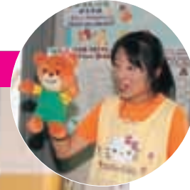
子育てサロン サンサンルーム 10時45分