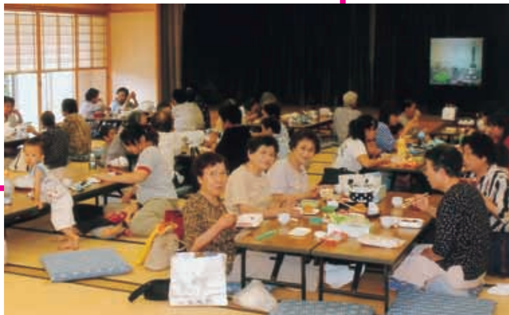
あじさいの間 正午

「健康コーナー」の手前には、100畳の和室「あじさいの間」があります。お昼には、昼食をとる利用者でいっぱいになります。