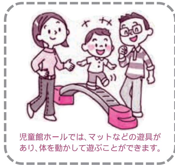
児童館ホールでは、マットなどの遊具があり、体を動かして遊ぶことができます。