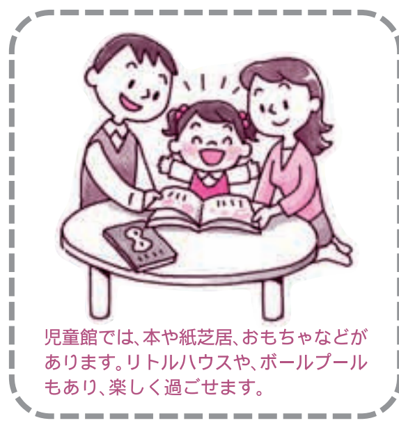
児童館では、本や紙芝居、おもちゃなどがあります。リトルハウスや、ボールプールもあり、楽しく過ごせます。