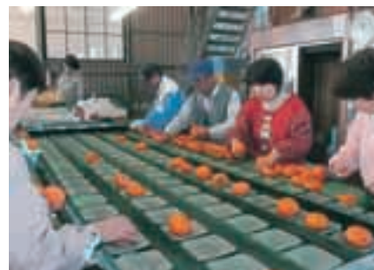
△柿の選果風景(山之上町)