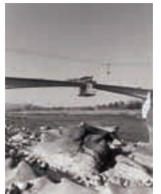
▲工事中の中濃大橋（S43）