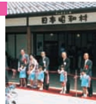
▲テープカットの様子