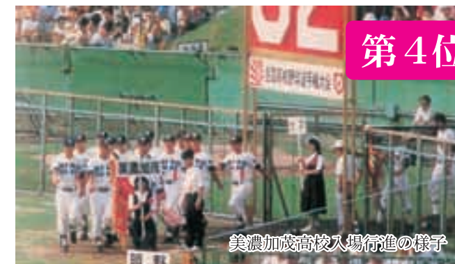
美濃加茂高校入場行進の様子