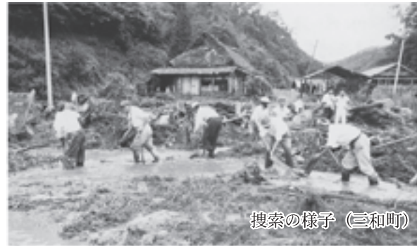
搜索の様子（三和町）

● 8.17 災害。17 日から 18 日未明にかけて集中豪雨が襲い、三和町の川浦地区を中心に大きな被害が発生。市内の雨量 387 ミリ。死者 7 人