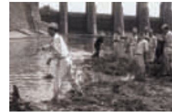
▲今渡ダム下流側の搜索の様子（8月25日）