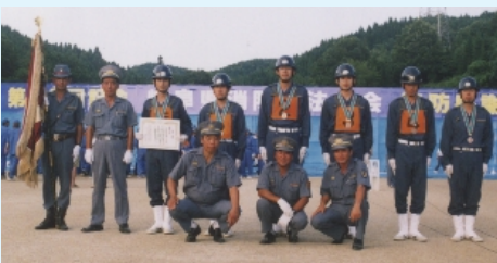
8月5日(日)に瑞浪市で開催された「第50回 岐阜県消防操法大会」において、優秀賞に輝い た第7分団(三和町)のみなさん。