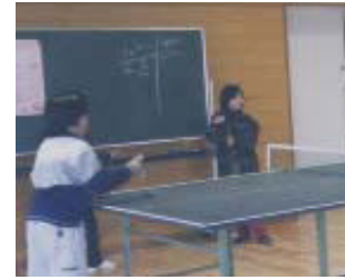
卓球教室もあります。

加茂野児童館は、昨年4月開館しました。加茂野保育所に併設しており、加茂野保育園の園児たちとは、いつも交流しており仲の良い兄弟のようです。児童館の自慢は、なんといっても全天候型の遊び場所です。雨の日でも、寒い日でも大丈夫。こども、子育て支援センターと同様に、親同士の情報交換や交流の場となっています。