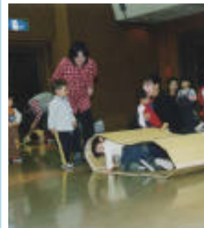
楽しい運動会もあります。