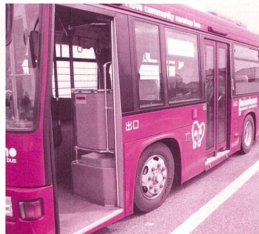
Saída pela porta da frente