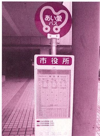
Ponto de ônibus