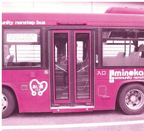
Entrada pela porta central