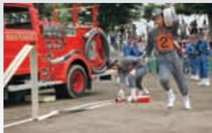
※競練会の出場順位は、大会当日操法終了後抽選により決定