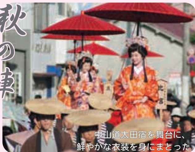
中山道太田宿を舞台に、鮮やかな衣装を身にまとった