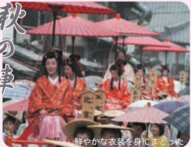
鮮やかな衣装を身にまとった

5人のお姫様を中心とした時代行列が、中山道太田宿をゆっくりと進みます。見る人を歴史の世界へといざなう華やかなお祭りです。