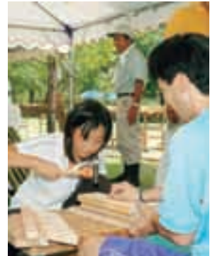
※道具は準備しますが持参でも構いません