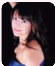
Vo. Piano: Chia