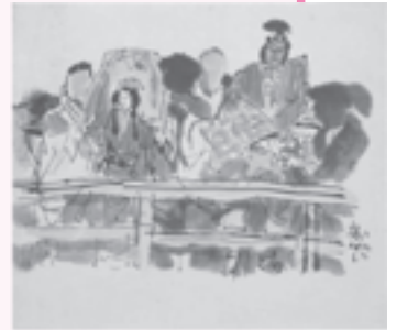
▼戻橋 坪内節太郎 (岐阜県美術館所蔵)