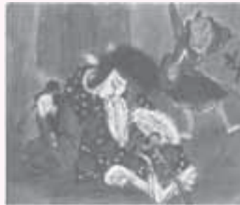
▲菅原伝授手習鑑 寺子屋の場 松王首実検 中川とも (岐阜県美術館所蔵)