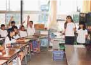
▲古井小学校アミーゴタイムの様子