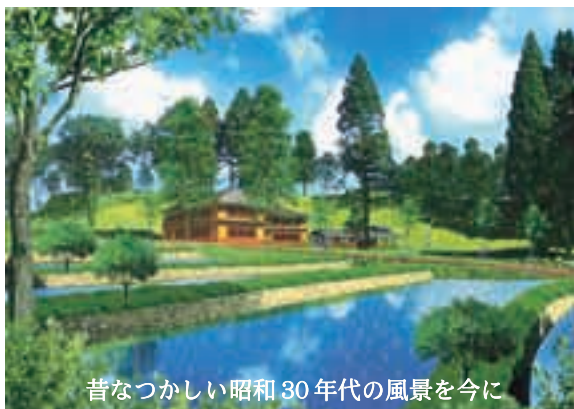
昔なつかしい昭和30年代の風景を今に

※当日は大変混み合うことが予想されます。 ※国道41号、418号、市道山手線の渋滞が予想されます。お出かけの際は十分ご注意ください。