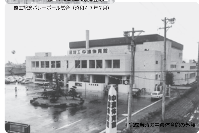
完成当時の中濃体育館の外観