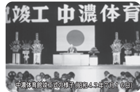
中濃体育館竣工式の様子(昭和47年7月16日)

中央体育館プラザちゅうたいは、今年の7月で30年を迎えました。昭和47年7月に、中濃地区でスポーツの拠点となるべく、完成した中濃体育館（現プラザちゅうたい）は、当時、県民体育館に次ぐ体育施設で、スポーツに携わる人たちにとって、夢のような場所だったようです。 「プラザちゅうたい」は、市民スポーツの振興に貢献した場所であると同時に、「スポーツ」と「人」の出会いの場所でもあります。 今回の特集は、「プラザちゅうたい」を利用している人たちにスポットをあて、思い出やスポーツに対する情熱、今後のスポーツのあり方などについて聞いてみました。