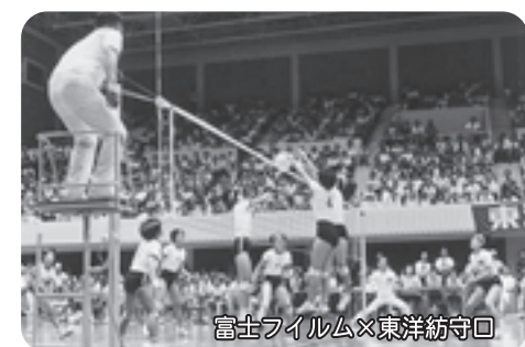
富士フィルム×東洋紡守口竣工記念バレーボール試合(昭和47年7月)