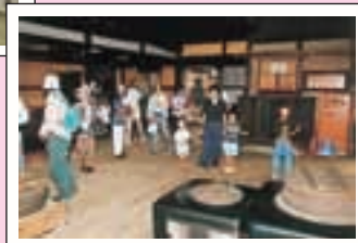
右：旧太田脇本陣林家住宅の一般開放