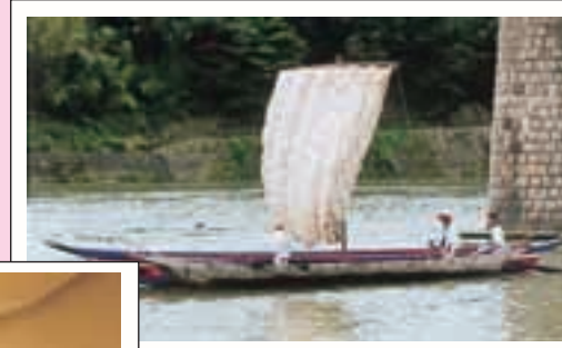
上：帆掛け舟の実演