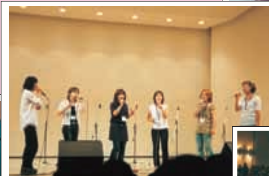
上：熱唱の参加者「ハモりん祭」にて