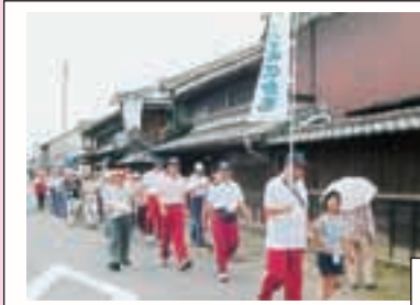
上：中山道ウォーク