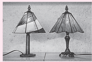
▲八面体ランプシェード

◇内容 グラスや小鉢などを制作します ◇対象 一般成人 ◇定員 各コース2人 ◇受講料 21,000円(材料費込み)